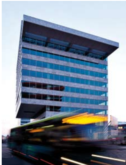
Die Fondsimmoblie liegt im Zentrum der wachsenden Stadt Almere in den Niederlanden.

Ein weiteres Lob erhält der Buss Immobilienfonds 3 nun von der Seppelfricke & Co. Family Office AG. Zusammen mit dem Branchenmagazin „Das Investment“ stellt