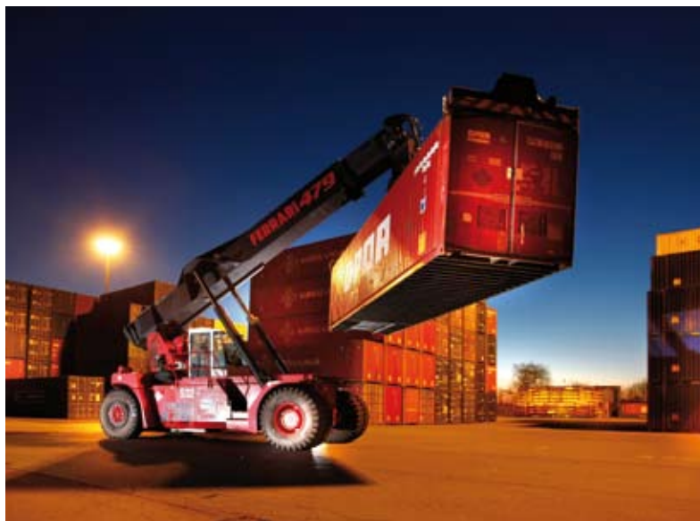
Für ältere Container gab es eine Sondersituation. Dies nutzte der 2005 aufgelegte Global-1-Fonds – zur Freude der rund 2.900 Anleger.

Containerleasinggesellschaft ist es selbst während der zwischenzeitlichen Transportkrise gelungen, eine hohe Auslastung zu realisieren. Weil Buss Capital Singapur Anfang 2009 staatlich zertifiziert wurde,