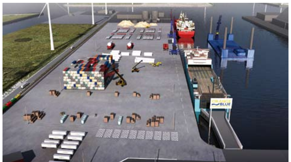
Orange Blue Terminal: 630 Meter Kai und eine große Terminalfläche für eine Vielzahl von Gütern – insbesondere für den Bau und die Versorgung der in der Nordsee geplanten Windparks.

Buss-Geschäftsführer Heinrich Ahlers betont: „Mit der Energiewende in Deutschland ruhen die Hoffnungen aller politischen Kräfte auf den erneuerbaren Energien, und dabei im besonderen Maße auf der Windenergie. Unser neuer Standort bietet optimale Bedingungen für die Offshore-Industrie in der Nordsee – auf diese Weise kann und wird Buss seinen Beitrag zur Neuausrichtung der Energiepolitik leisten.“ Allein in der Nordsee sind zurzeit 21 neue Windparks in Planung.