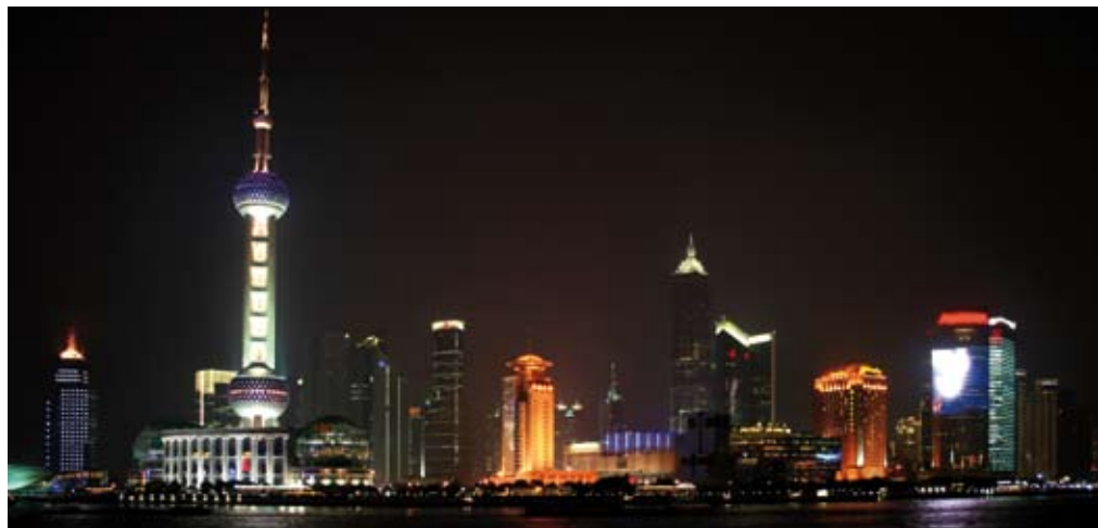
In Shanghai sind die Umschlagsraten in den letzten Monaten kontinuierlich gestiegen.

Gleichzeitig ist der Einkaufspreis für Container vergleichsweise niedrig – und der Einstiegszeitpunkt günstig. Denn mittelfristig werden die Produktions- und Materialkosten für Container wieder steigen – und damit auch die Einkaufspreise. Darüber hinaus ist die finanzielle Situation zahlreicher Reedereien angespannt. Um Eigenkapital zu generieren, verkaufen viele Reedereien Container und mieten sie anschließend wieder zurück: Stieg